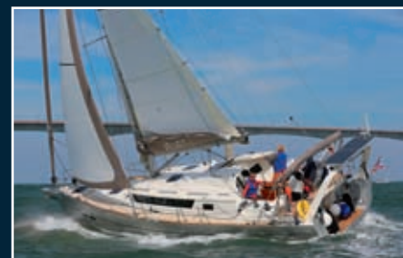
P. 150 Exploration 45