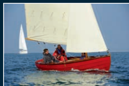
P. 78 Stir-Ven 19