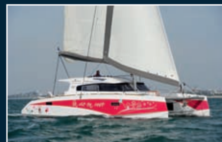
P. 180 Aventura 43