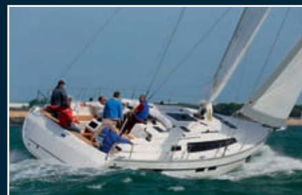
P. 154 Bavaria 46