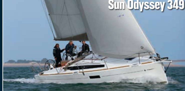
Sun Odyssey 349