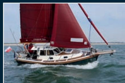
P. 94 Haber 660