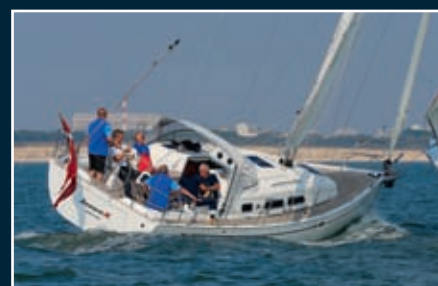
P. 122 Xc 35