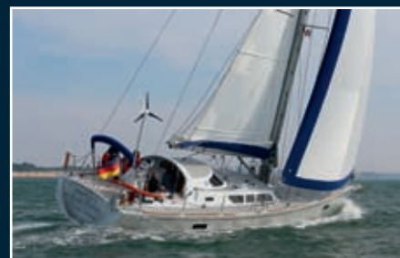
P. 158 Boreal 52