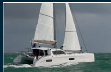
P. 182 Outremer 45