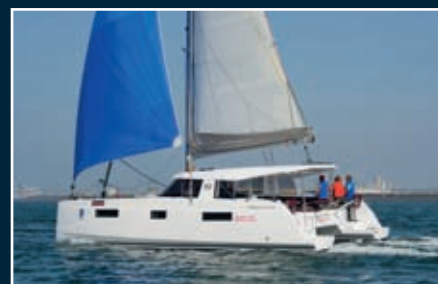
P. 174 Nautitech Open 40