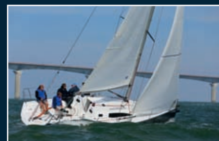
P. 116 J/97 E