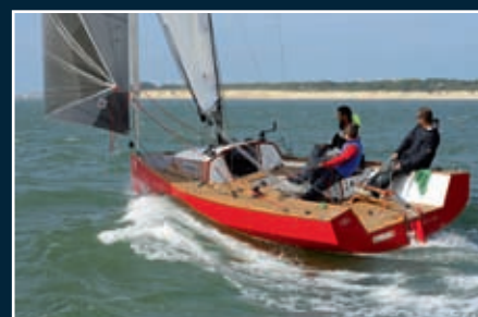
P. 102 X.0