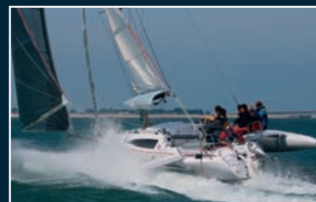
P. 170 Cruze 970