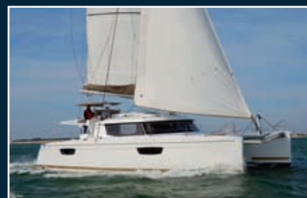
P. 186 Saba 50