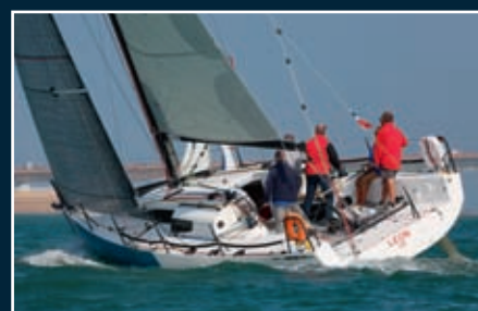
P. 132 JPK 10.80