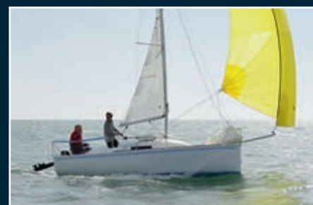
P. 82 Squid 5.50