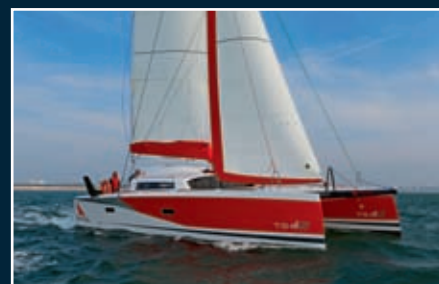
P. 176 TS 42