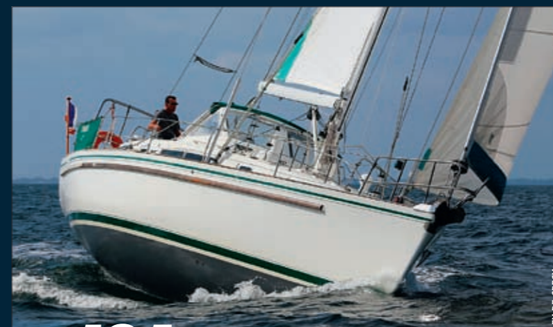
FX DE CRECY

60. Route du Rhum. Taille des bateaux, nombre d'engagés : une édition qui bat tous les records