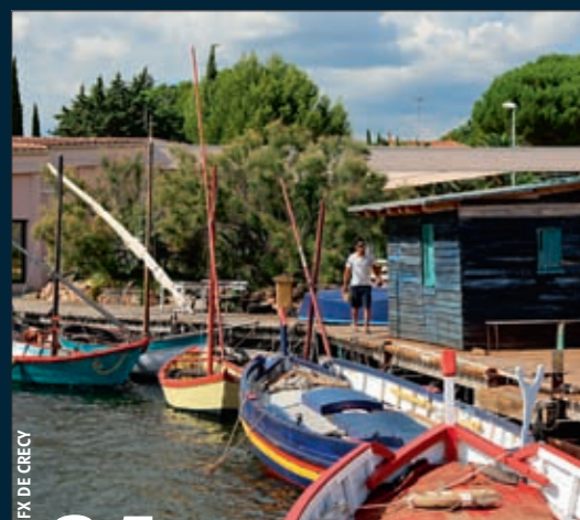
FX DE GRECY