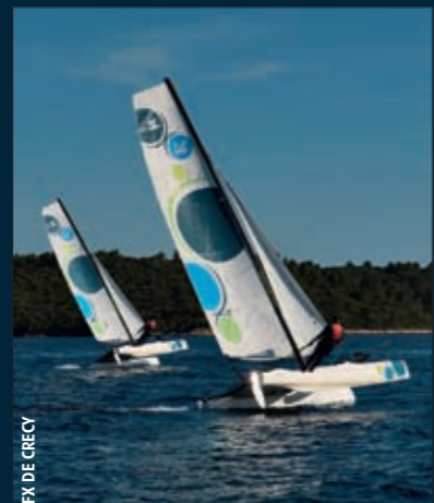
FX DE GRECY

104. Retailer un panneau pour une meilleure étanchéité