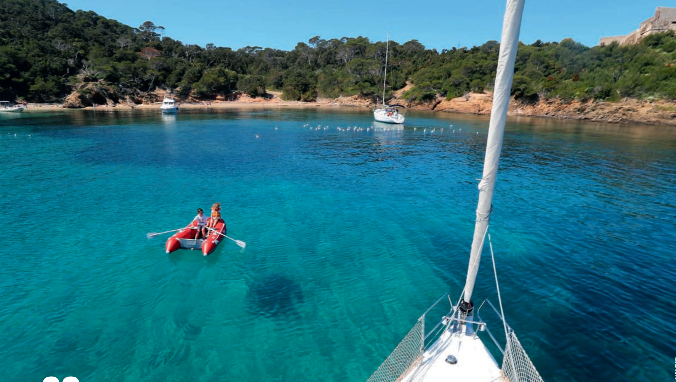
FX DE GRECY