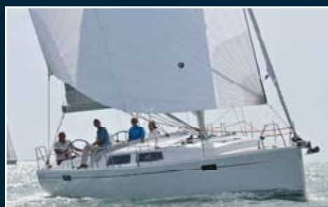
150. Hanse 385