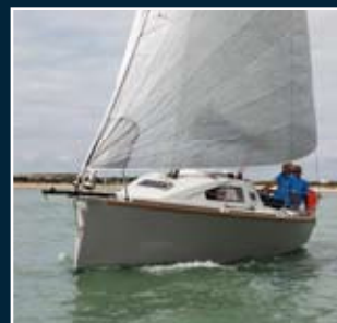
108. Samba 235