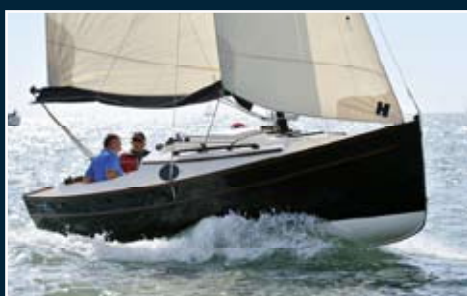
98. Bay Cruiser 23