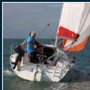
110. Maxus 21