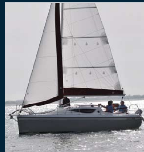
114. Maxus 24