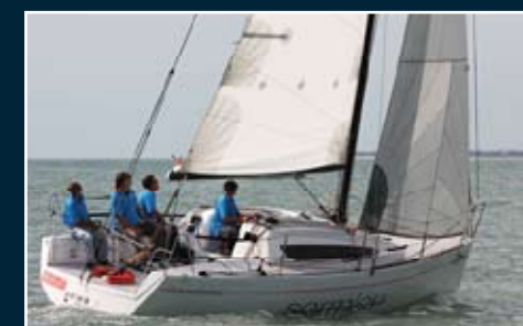
130. Sormiou 29