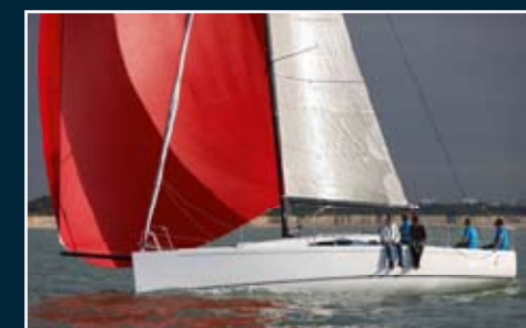
144. J 111