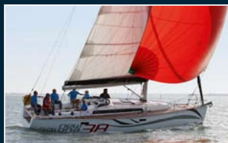
154. Salona 38