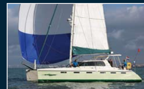
188. FastCat 435