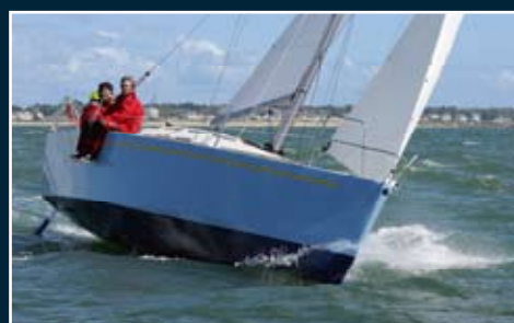
126. Craff 29.5