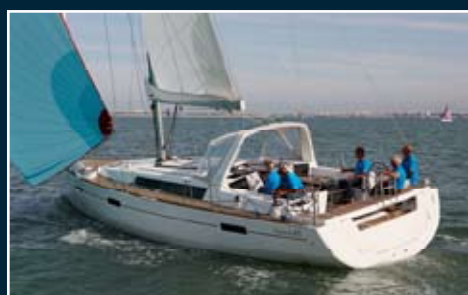
168. Océanis 45