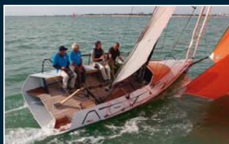
120. Leggero L8