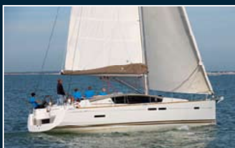
166. S. Odyssey 44 DS