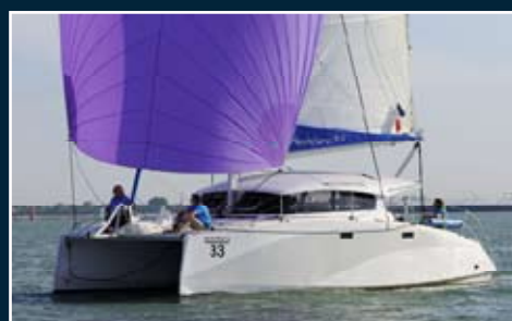
184. Aventura 33