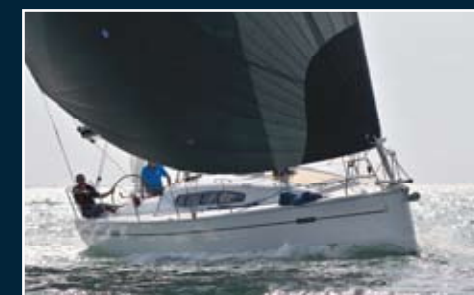
160. Dehler 41