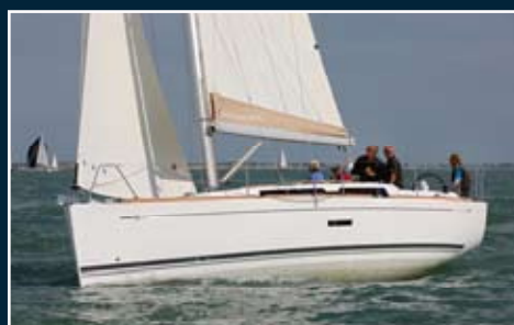
136. Dufour 335