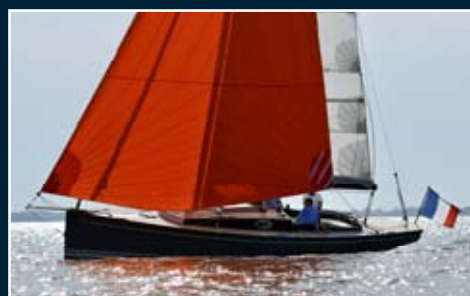
140. Solenn 32