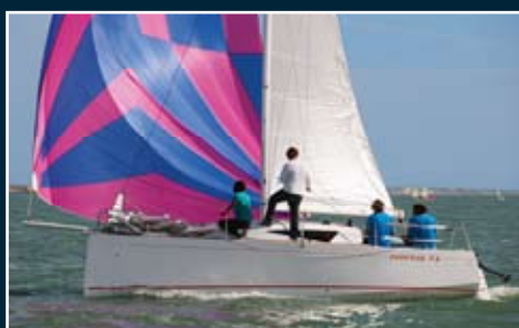
116. Kerkena 7.6