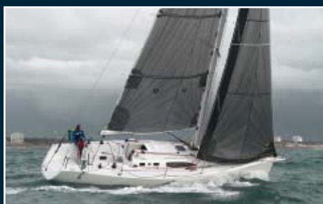
148. J 108