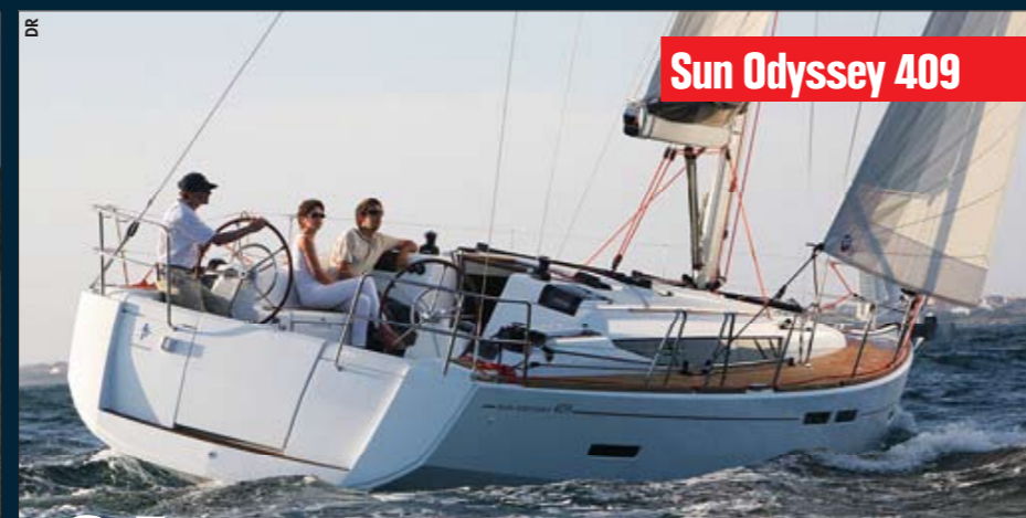
Sun Odyssey 409

110. Quel panneau solaire choisir : souples ou rigide ?