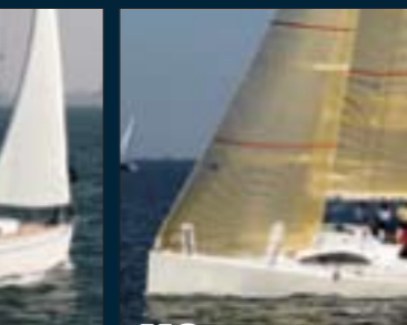
112. A 31