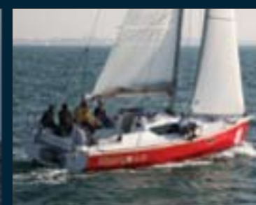
122. Malango 9,99