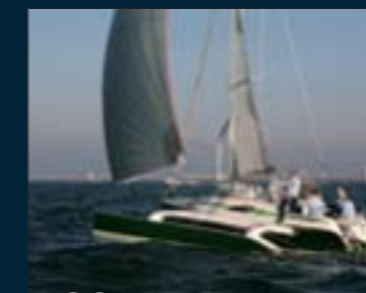
180. Dragonfly 28