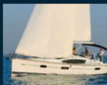
146. Sun Ody. 42 DS