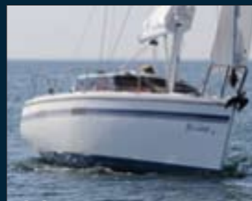
98. Bi-Loup 26