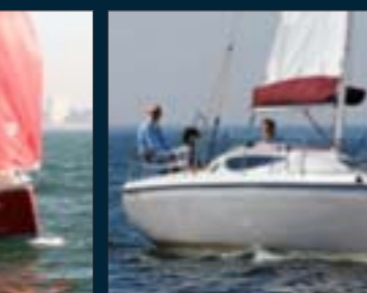
90. Maxus 24