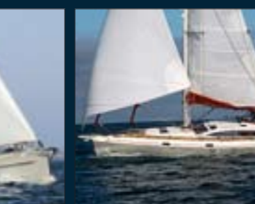
162. Allures 51