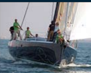
168. Ourson Rapide