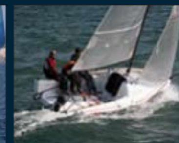
78. Seascape 18