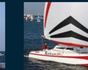
176. Rackam 26