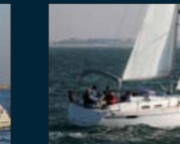
108. Bavaria 32