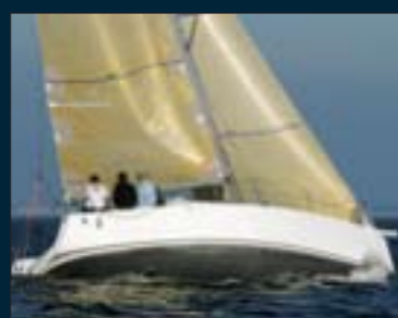
112. J 97