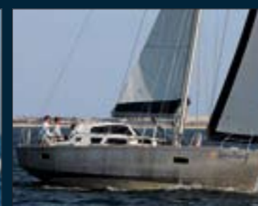
154. Boréal 44