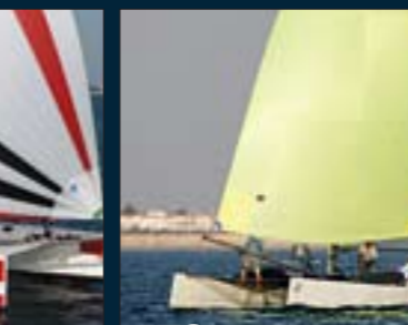
178. Virus V8