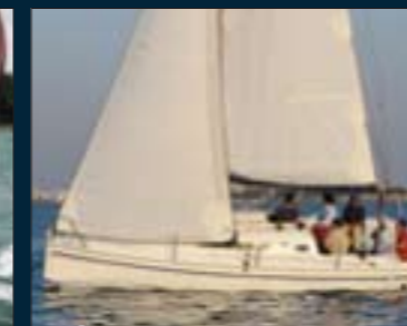
104. Tucana 28