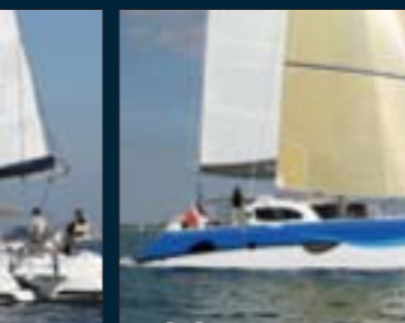
190. Outremer 49