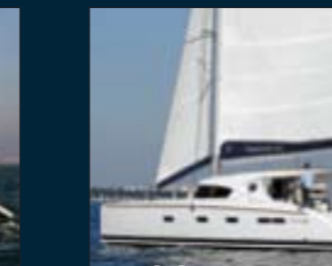
186. Nautitech 442