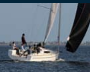
112. Elan 310