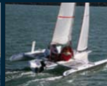
172. Tricat 23.5