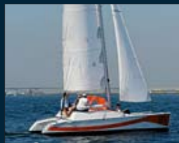
170. Aventura 23 Raid