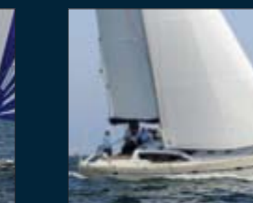
154. RM 1350