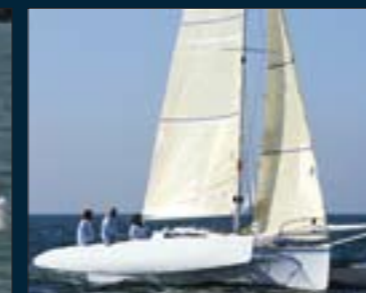
174. Corsair Dash