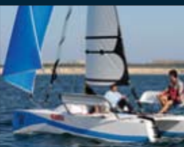
58. Aventura 20

Le prochain numéro de Voile Magazine sortira en kiosque le 17 décembre 2009