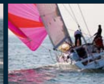
128. First 35