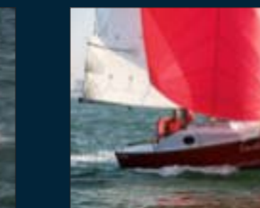
82. Clin d'Œil