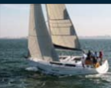
138. Dufour 405