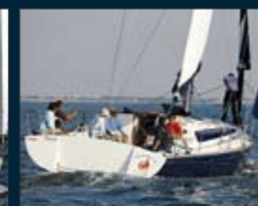
154. Oléa 44