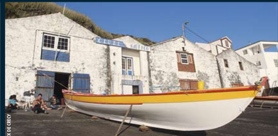
FX DE CRECY

94. Comparatif : comment choisir une balise SARSAT ?